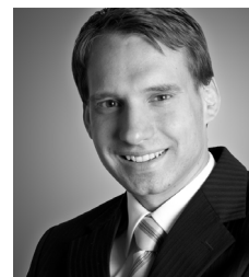
Autor: Dipl. Soz. Konstantin Schultes

Entwicklungspassage modellieren, in der vielfältige Faktoren zusammenwirken.