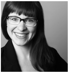
Autorin: Dipl.-Psych. Caroline Trautwein

Was ist ein gelingendes Studium? Zu dieser Frage kann die Studienerfolgsforschung Kriterien liefern,