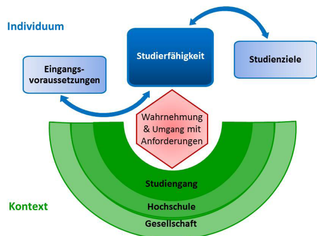
Abbildung 1: Theoretischer Rahmen (eigene Darstellung)

Der theoretische Rahmen (siehe Abbildung 1) fokussiert das Wechselverhältnis von Individuum und Kontext, wobei er die Wahrnehmung von und den Umgang mit Studienanforderungen in den Mittelpunkt rückt.