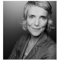
Autorin: Dr. Elke Bosse

für die Gestaltung von Studium und Lehre in der Studieneingangsphase. Um individuelle und institutionelle Aspekte miteinander zu verschränken, greift das Projekt auf Forschungsansätze zu Studienerfolg und Hochschulsozialisation zurück.