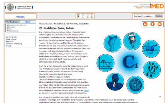
iMED Textbook: Einstiegsseite zu Modul C1

Das Medizinstudium besteht aus ungefähr 50 Fächern: den klinischen Fächern, z. B. Innere Medizin, den klinisch-theoretischen Fächern, z. B. Pharmakologie, sowie den theoretischen Fächern, z. B. Biochemie. Während die theoretischen Fächer bislang im vorklinischen und die klinischen und klinisch-theoretischen Fächer im klinischen Studienabschnitt unterrichtet wurden, findet im Modellstudiengang iMED bereits ab dem ersten Semester eine Vernetzung der Fächer statt. Dadurch werden Studierende frühzeitig mit einer Fülle von Fachgebieten konfrontiert, für die jeweils umfangreiche Lehrbücher zur Verfügung stehen, aus denen jedoch oft nur einzelne Aspekte erforderlich sind. Gerade vor dem Hintergrund der hohen Präsenzzeiten ist diese Auswahl für Studierende nur schwer zu leisten. Ein deutschsprachiges Lehrbuchangebot, das diesen Ansatz abbildet, gibt es bisher nicht.