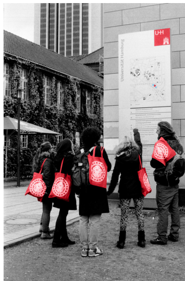
Ab 2017 geht das Universitätskolleg der Universität Hamburg in seine zweite Phase über – von der Experimentierphase zum Modellversuch.

Das Universitätskolleg wurde 2012 gegründet. Von Beginn an ist das vom Bundesministerium für Bildung und Forschung geförderte Vorhaben mehr als ein gewöhnliches Drittmittelprojekt: eine direkt am Präsidium verankerte Organisationseinheit unter Beteiligung aller Fakultäten der Universität Hamburg, mit zusätzlichen Teilprojekten, die aus anderen Finanzierungsquellen als dem Qualitätspakt Lehre (QPL) Teil des Gesamtprojektes sind. Dennoch wird das Universitätskolleg auch nach vier Jahren oft nur als ein zeitlich begrenztes Projekt wahrgenommen, nach dessen Beendigung alles wieder in den vorherigen Zustand zurückkehrt. Dieser Eindruck wird auch durch den aktuellen Ablauf